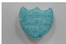
Slika 1: Modra tabletk Dom Perignon