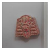
Slika 2: Roza tabletk s pikicami in logotipom faraona