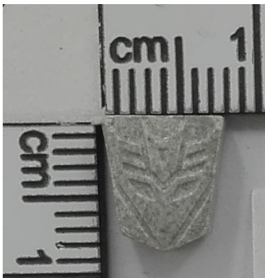
Siva tabletki Transformer (148 MDMA)

V Mariboru je bila zaznana tudi siva ekstazi tabletki Transformer z visoko vsebnostjo MDMA (148 mg/tbl), ki predstavlja večje tveganje za zdravje uporabnikov in za pojav negativnih učinkov.