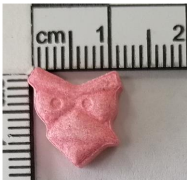
Roza Angry Bird (215 m MDMA)