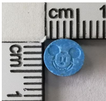
Lažna 2C-B tabletka

V Ljubljani je bila zbrana tudi modra tabletka z logotipom Miki Miške, ki je bila kupljena na darknetu kot 2C-B. Analiza je pokazala, da tabletka vsebuje snov 2-Br-4,5 DMPEA. Snov naj ne bi bila psihoaktivna, ni pa mogoče izključiti toksičnih stranskih učinkov. Ker tveganja, negativni stranski učinki in dolgoročne posledice uporabe niso znani, se uporaba tabletko odsvetuje.