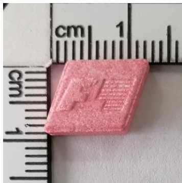
Roza Formula 1 (213 mg MDMA)